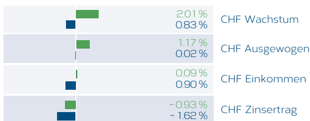
Anlagestrategien in CHF ■ QTD ■ YTD